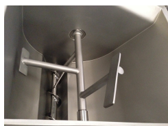
Brazo mezclador TX114 ML / TX32 ML