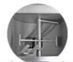
Brazo mezclador TX98 MINIMIX