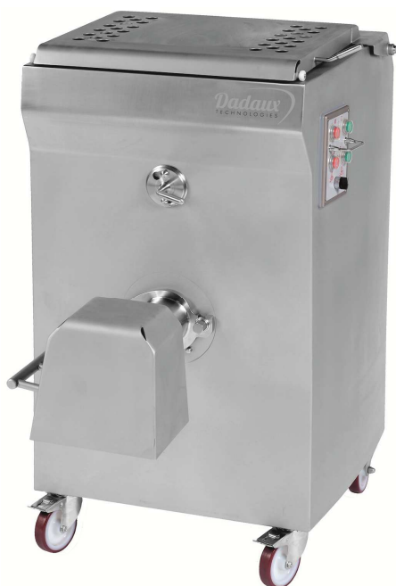
TX32 ML / TX114 ML